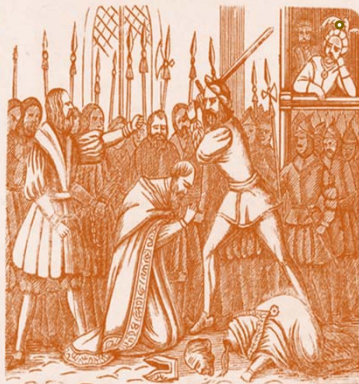
Fig. 2 – Undvik huvudlösa beslut. Välj rätt kö till baren.