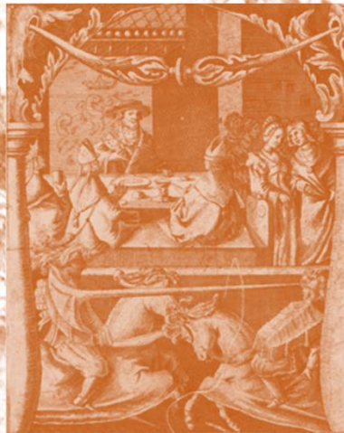
Fig. 1 – FK äser fredagens gäster dra en lans för en treflig stämning.

Kl. 00.30 Träffa gobbe: ”Vafalls, har du inget AB, är du en 0:a?” Bli något Ro-. Genomför hel balhelg, återbli Ro+.