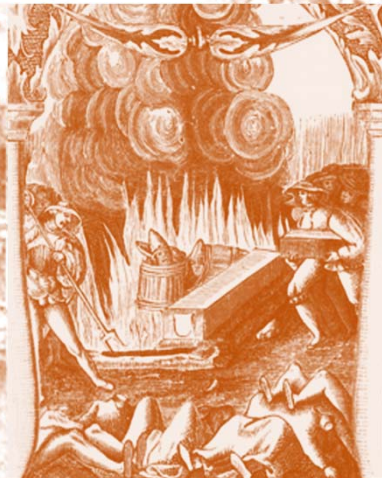
Fig. 3 – Medicinskt korrekt bild av situationen inne i huvudet efter balbelg.

Kl. 08.00 Önska dig Brasklappen mer än någonsin. Blodsmak i munnen. Stanna hem-och-globion!